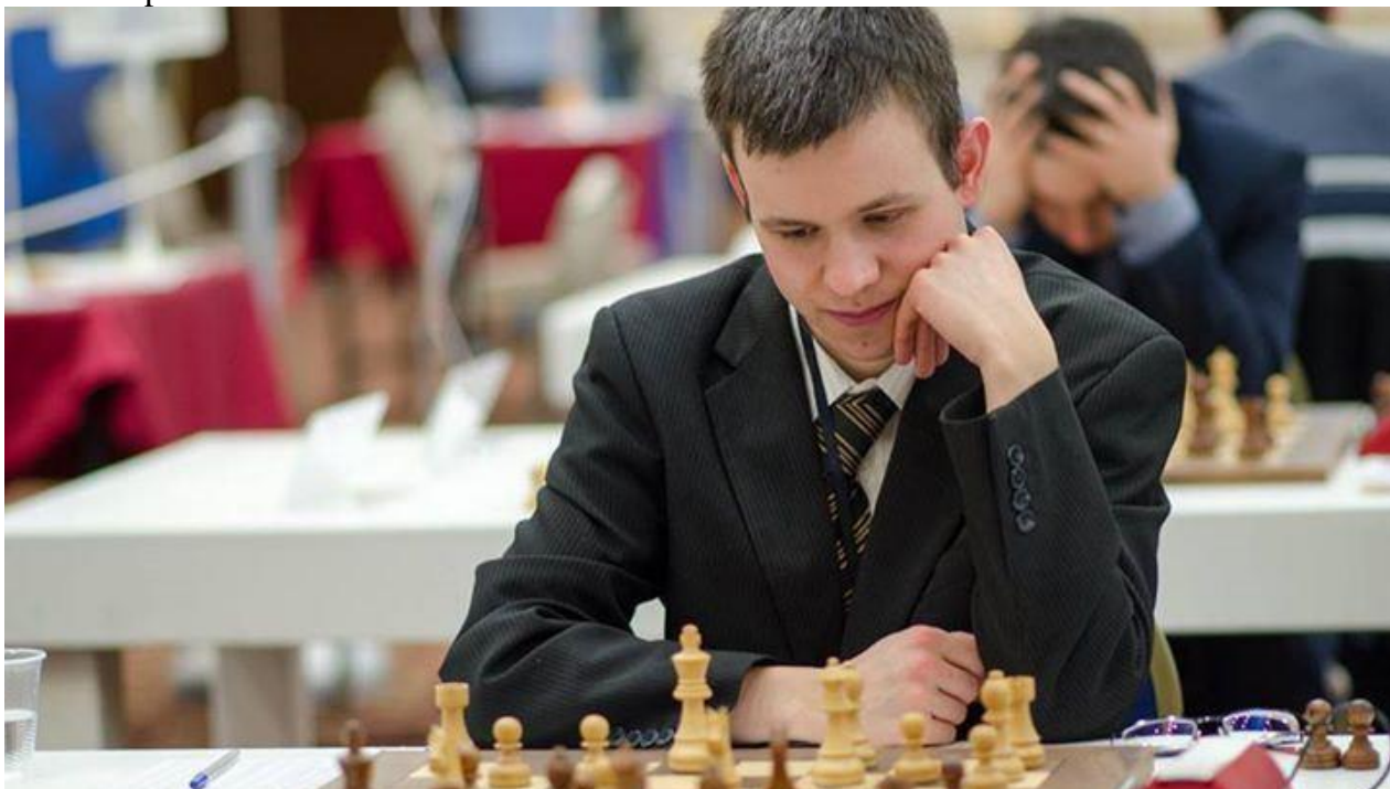
David Navara na šachovém ME 2015