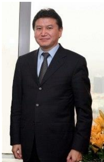
Kirsan Iljumžinov, prezident FIDE

FIDE je jednou z největších a nejstarších sportovních organizací na světě. Byla založena v roce 1924 a Československo bylo jedním z patnácti zakládajících členů. Nyní je jejími členy 185 národních federací. Jejím heslem je Gens una sumus (Jsme jedna rodina).