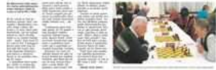
Senioři si dali partičku šachu na mistrovském setkání