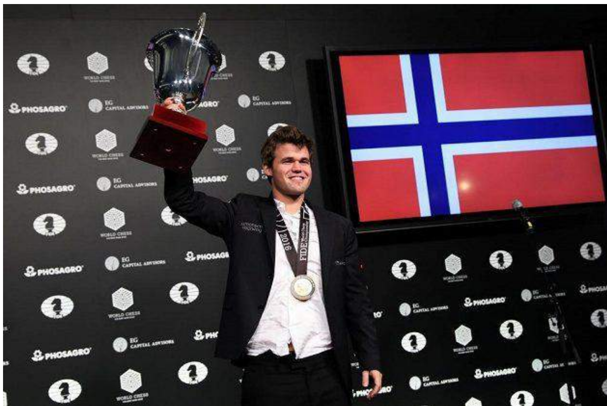
Nor Magnus Carlsen s trofejí pro šachového šampióna.

Nor Magnus Carlsen zůstává mistrem světa v šachu. V střeďečném tie-breaku zápasu s ruským vyzývatelem Sergejem Karjakinem v New Yorku vyhrál dvě ze čtyř partií v rapid šachu se zkráceným časem. V den svých 26. narozenin tak podruhé obhájil titul, který získal v roce 2013 výhrou nad Indem Višvánáthánem Ánandem.