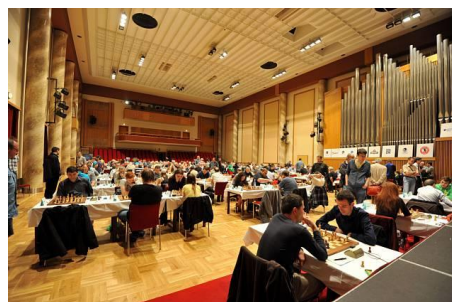
Ostravský koník 2016. Ilustrační foto.