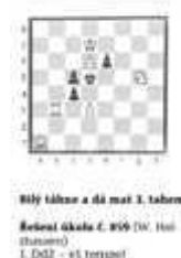
Bílý táhne a dá mat 3. tahem Řešení úkolu č. 859 (W. Hekele) 1. De2 - e5 tempo!