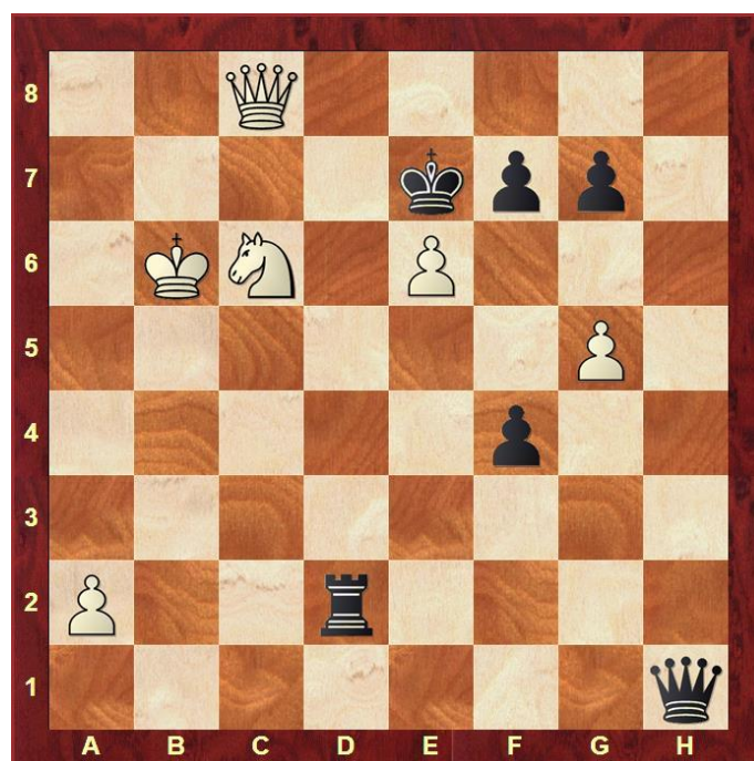
(Kasparov – Navara, pozice po 49. Jc6+)

Naproti tomu David Navara hned v prvním kole efektně prohrál s Levonem Aronjanem a jako by to předznačilo další průběh turnaje. Aronjan si vedl skvěle a Navarovi se příliš nedařilo. Ale prohry našeho reprezentanta si fanoušci za pár týdnů pamatovat nebudou. V historii daleko spíš zůstane partie ze sedmého kola, kdy se Navara vůbec poprvé střetl s Kasparovem. Partie se pro legendární „Bestii z Baku“ vyvíjela dobře, Kasparov získal velkou převahu po zahájení a vzniklou koncovku by nejspíš s Navarou vyhráli i daleko slabší hráči. V časové tísni ale exmistr světa udělal několik nezvyklých chyb, nejlepší český šachista hledal své šance a podařilo se mu partii vyrovnat. Když pak Kasparov spadl do závěrečné léčky, Navara slavil překvapivé vítězství.